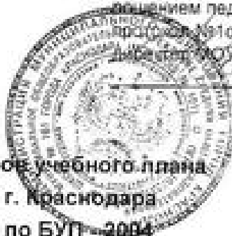
ТАБЛИЦА - сетка часов учебного плана МОУ СОШ №101 г. Краснодара для 5-8 классов по БУП-2004 на 2010-2011 учебный год