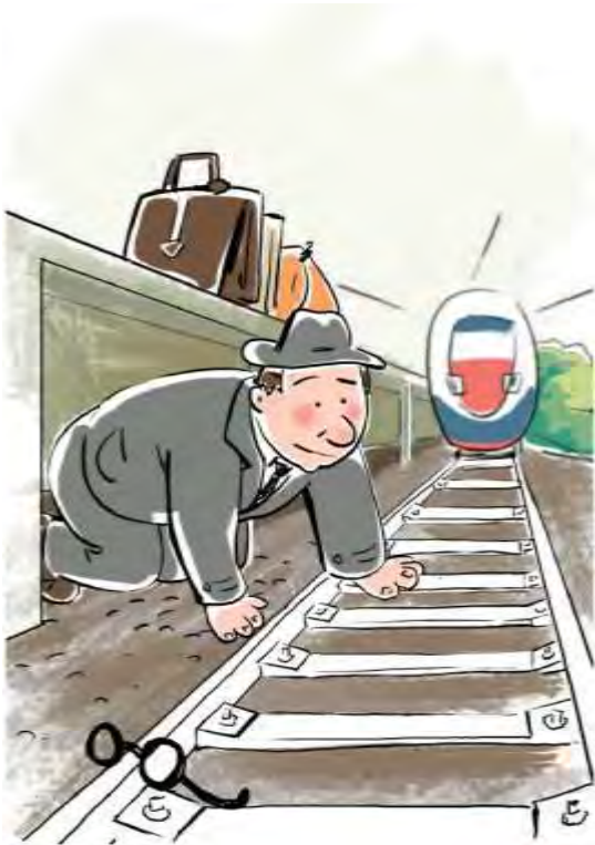
Не подлезайте под платформы и железнодорожные составы!